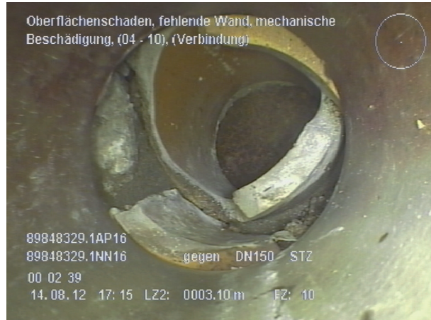
Defekte Leitung – Fehlende Wand

Undichte Abwasserkanäle auf privaten Grundstücken können durch Eindringen von Grundwasser zu einem erhöhten Anteil „Fremdwasser“ und damit zu Problemen bei der Abwasserableitung und -reinigung führen. Ebenso ist ein Austritt von Abwasser und dadurch eine Schadstoffbelastung von Boden und Grundwasser möglich. Unter Umständen sind damit sogar Gefahren für die öffentliche Trinkwasserversorgung verbunden.