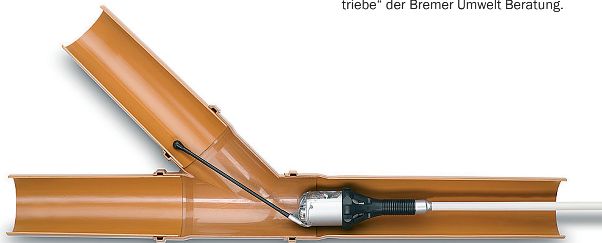
Zustandserfassung mit der Dreh-/Schwenkkopfkamera IBAK Orion L („Kieler Stäbchen“)

Gefördert werden 35 Prozent der entstandenen Kosten, höchstens jedoch ein Betrag in Höhe von 250,- Euro je Zuschussempfänger.